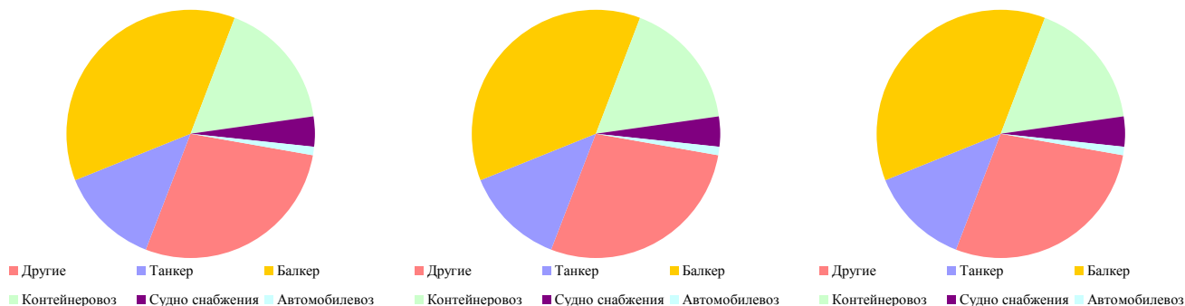
Рисунок 2. Структура портфеля заказов на постройку судов (по CGT), 2015, 2016 и 2017 гг.