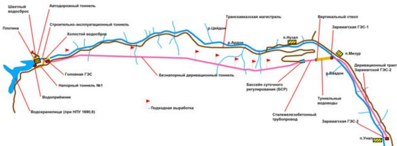
Схема каскада Зарамагских ГЭС