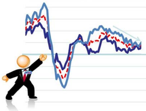
Динамика РТО РФ 2005-13 в % к соответствующему периоду предыдущего года