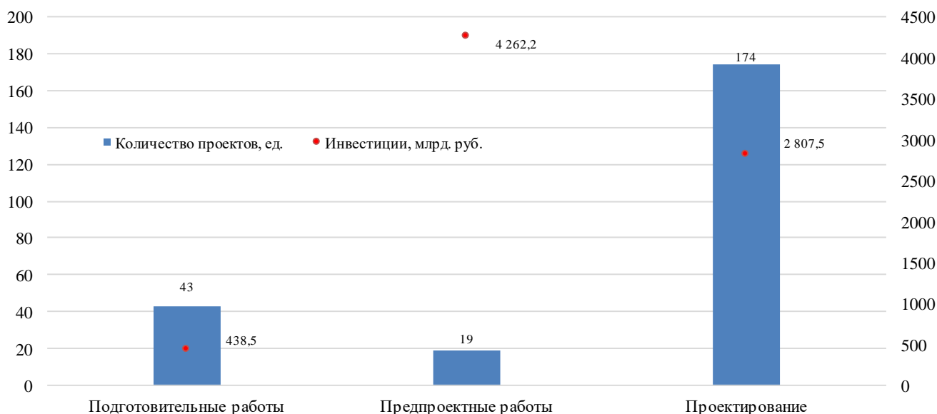
Распределение инвестиционных проектов по стадиям строительства, кол-ву проектов и объему инвестиций

Инвестиции в строительство одного объекта, представленного в Обзоре, составляют не менее 1 млрд рублей . Общий объем инвестиций в проекты, описанные в Обзоре, составляет более 7,5 трлн рублей .