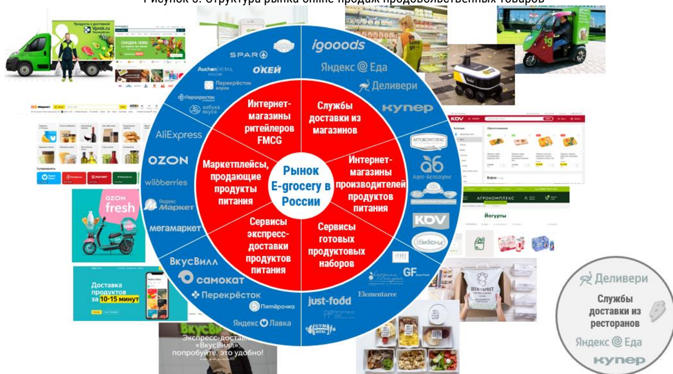
Рисунок 3. Структура рынка online-продаж продовольственных товаров

некоторые инновационные концепции (например, "Кухня на районе") или проекты ритейлеров FMCG в сегменте dark kitchen (например, "Много лосося"), однако данный сегмент при оценке емкости рынка online-продаж продовольственных товаров не учитывается.