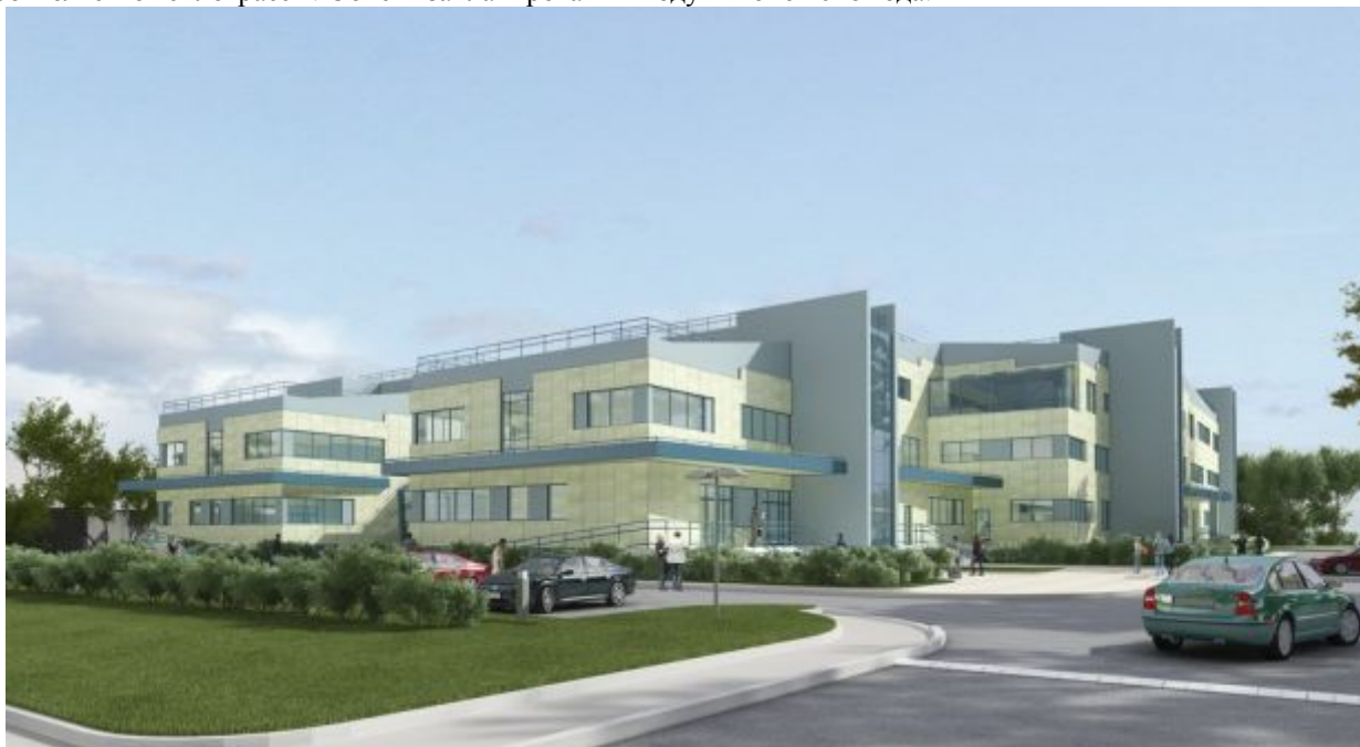
Актуализация - Уточнено представителем компании

По состоянию на декабрь 2017 года готовность объекта составляет около 60%. ООО "Глобал-Строй" закончил работы по вертикальной планировке территории строительства, также до конца 2017 года планируется закончить строительство теплотрассы. Объект запланирован к вводу в июне 2018 года.