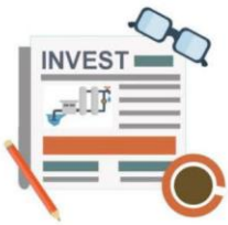
Газеты и журналы