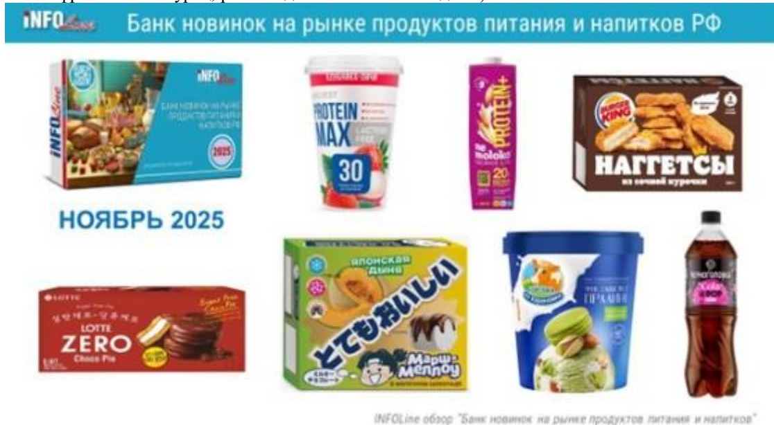
INFOline обзор "Банк новинок на рынке продуктов питания и напитков"