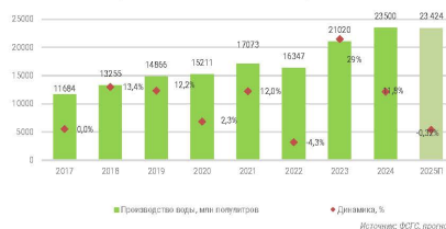
Производство питьевой и минеральной воды