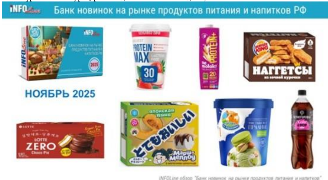
INFOLine обзор "Банк новинок на рынке продуктов питания и напитков"

Лимитированные выпуски в предновогодний период: