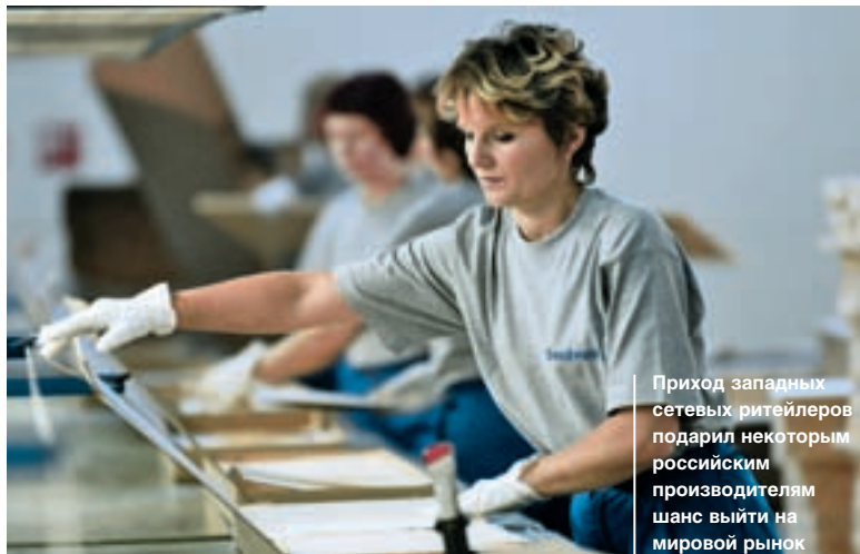
Приход западных сетевых ритейлеров подарил некоторым российским производителям шанс выйти на мировой рынок