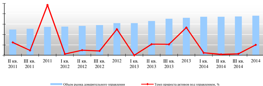
Динамика рынка доверительного управления II кв. 2011- 2014 гг, трлн. руб.

Ухудшение экономической ситуации в России, в том числе из-за противостояния с западными странами и падения цен на нефть, на фоне заморозки передачи пенсионных накоплений в НПФ в конечном счете не способствовало привлечению новых инвесторов.