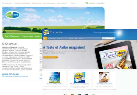
Корпоративные порталы российских и зарубежных компаний

Для создания «Банка новинок» и «Каталога новинок» мы используем: