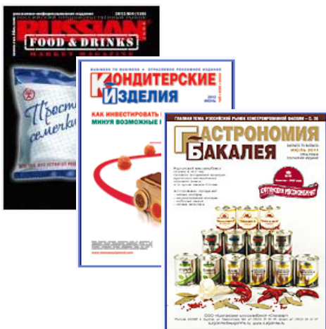
Отраслевые журналы и газеты