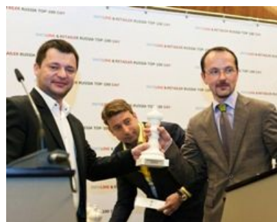
«Аптечная сеть 36,6» , номинация «Лучшие среди равных» в сегменте «Аптеки»

Лидерами по выручке в своих отраслях (номинация «Лучший среди равных») стали X5 Retail Group (FMCG-сегмент, 452,53 млрд руб.), «М.Видео» (БТиЭ, 111,86 млрд руб.), «Евросеть» (мобильные устройства, 75,1 млрд руб.), Leroy Merlin (DIY&Household, 50,1 млрд руб.), IKEA (мебель, 48,55 млрд руб.), ГК