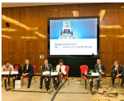
INFOLINE & RETAILER RUSSIA TOP-100 DAY 2012 , ток-шоу «ТОП-100 в вопросах и ответах»