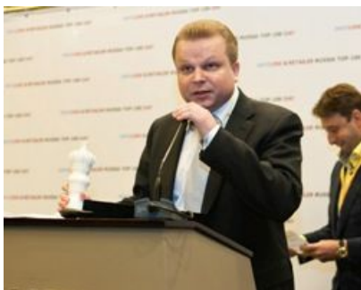
«Центробувь» , номинация «Лучшие среди равных» в сегменте «Одежда и обувь»