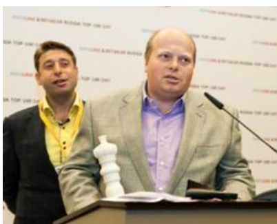
«М.Видео» , номинация «Лучшие среди равных» в сегменте БТиЭ