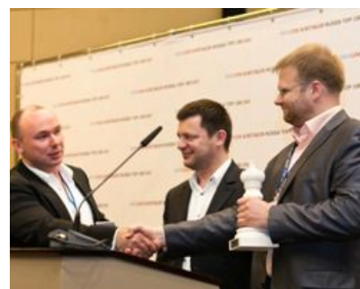
«Юлмарт» , номинации «Самые динамичные» и «Дебютанты»