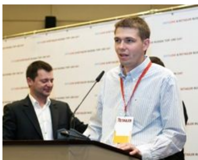
ГК Merlion , номинации «Дебютанты» и «Самые динамичные»