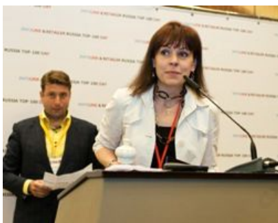
«Магнит» , номинация «Лидер по инвестициям»

Наиболее эффективной показали себя в 2011 г. в сегменте мобильных устройств — ГК «Связной», в сегменте DIY&Household - Leroy Merlin, в сегменте БТиЭ- «Медиа Маркт Сатурн», в сегменте FMCG - «Азбука вкуса», в сегменте детских товаров — компания «Спецобслуживание» («Дети», «Здоровый малыш»), в сегменте парфюмерии и косметики - «Рив Гош», в сегменте одежды и обуви — Bosco di Chillegi, в сегменте аптеки — A5, в сегменте компьютерной техники - re:Store Retail Group.