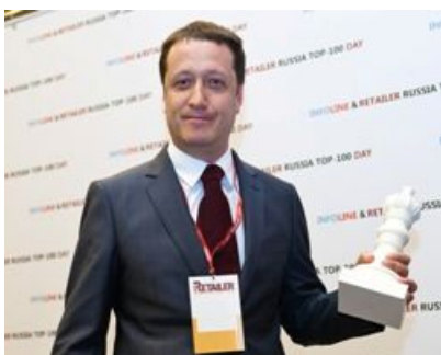
«МегаФон Ритейл» , номинация «Самые динамичные»

Самые высокие темпы роста по итогам 2011 г. продемонстрировал новичок рейтинга INFOLINE RETAILER Russia TOP-100 — ГК Merlion (сети «Позитроника», «Ситилинк» и «Ситилинк mini»), чья выручка увеличилась на 142,6 %. На втором месте оказалась «МегаФон-Ритейл» - розничный проект сотового оператора «МегаФон» (+138%) и компания «Бэст Прайс», развивающая сеть Fix Price (+136,7%).