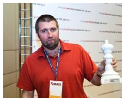
«Тверской продукт» , номинация «Дебютанты»