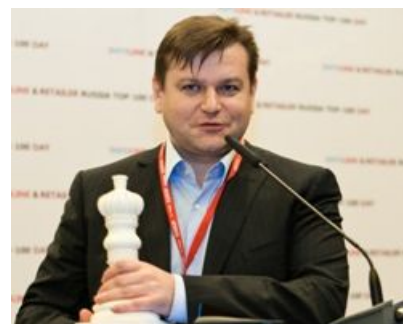
«Евросеть» , номинация «Лучшие среди равных» в сегменте «Мобильные устройства»