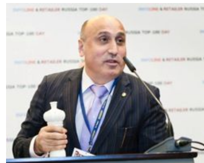
«Кораблик» , номинация «Дебютанты»