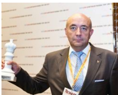
Спортмастер , номинации «Лучшие среди равных» в сегменте «Спортивные товары» и «Самые динамичные»