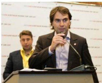
A5 , номинации «Дебютанты», «Самые динамичные» и «Самые эффективные»