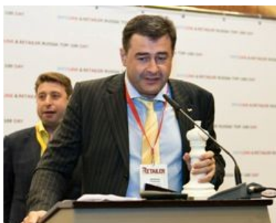
X5 Retail Group , номинация «Лучшие среди равных» среди компаний всех сегментов