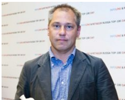
«Холидей классик» , номинация «Крепкие регионалы»