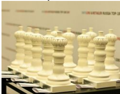
Белые шахматные короли – призы за победу в номинациях INFOLINE RETAILER Russia TOP-100