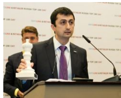
Детский мир , номинация «Лучшие среди равных» в сегменте «Детские товары»

Наиболее эффективной показали себя в 2011 г. в сегменте мобильных устройств — ГК «Связной», в сегменте DIY&Household - Leroy Merlin, в сегменте БТиЭ- «Медиа Маркт Сатурн», в сегменте FMCG - «Азбука вкуса», в сегменте детских товаров — компания «Спецобслуживание» («Дети», «Здоровый малыш»), в сегменте парфюмерии и косметики - «Рив Гош», в сегменте одежды и обуви — Bosco di Chillegi, в сегменте аптеки — A5, в сегменте компьютерной техники - re:Store Retail Group.