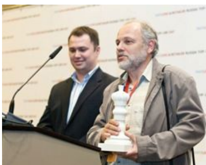
Л'Этуаль , номинация «Лучшие среди равных» в сегменте «Косметика и парфюмерия»