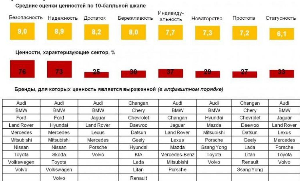
Рисунок 1. Результаты расчета индекса DNA.

Ценностям "Достаток" и "Статусность" соответствуют марки автомобилей премиального и высокого класса, такие как Audi, BMW, Jaguar, Range Rover, Lexus, Mercedes-Benz. Ценностям "Бережливость" и "Простота", напротив, соответствуют марки невысокого ценового сегмента, в числе которых китайские автомобильные бренды, а также Chevrolet, Renault и Lada. Наиболее важные ценности, которые являются как жизненными, так и ценностями, характеризующими сектор, присущи большинству автомобильных брендов, за исключением автомобилей китайских и российских брендов.