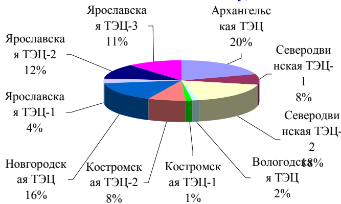
Структура установленных мощностей по электростанциям ОАО "ТГК-2" в 2012 году, МВт